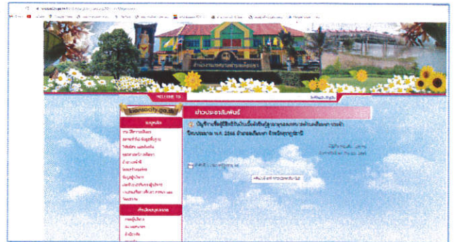
( https://kiansacity.go.th/html/new_post_view.asp?ID=๑๙๑๘&typenew=๑ )