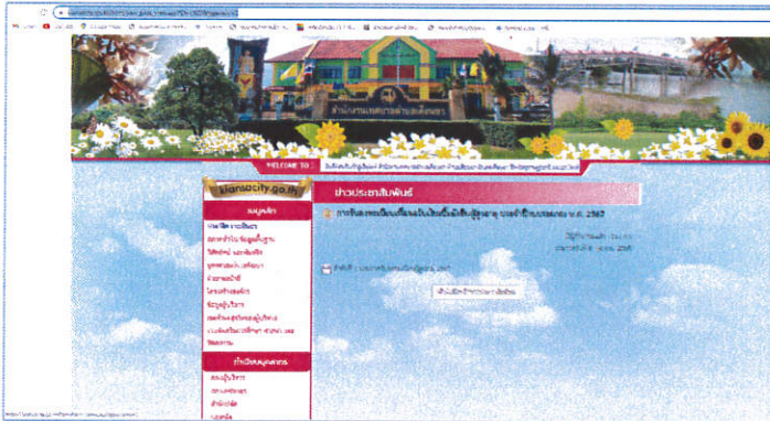
( https://kiansacity.go.th/html/new_post_view.asp?ID=๑๙๒๐&typenew=๑ )