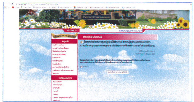
( https://kiansacity.go.th/html/new_post_view.asp?ID=๒๒๕๔&typenew=๑ )